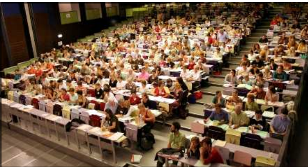
Les 300 militants du mouvement Artisans du Monde en Assemblée Générale

C'est pour essayer de répondre à cette dernière question qu'une " Nouvelle Politique Partenaires " a été proposée. Car vouloir travailler avec les