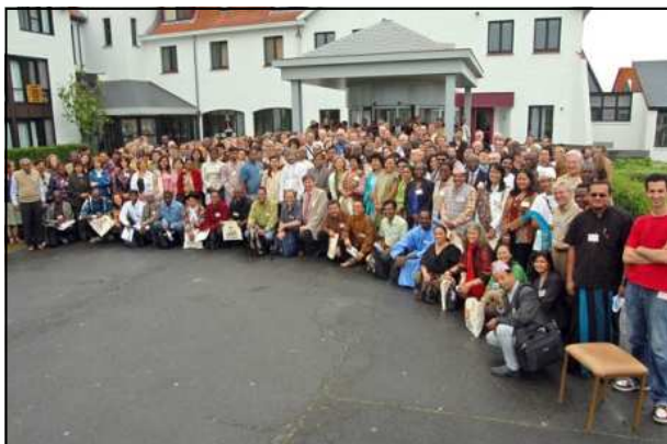
Les participants devant le centre de conférence

Elle a également été l'occasion de discuter de nombreux sujets d'actualité pour le mouvement du commerce équitable : normalisation ISO, projet de développement d'un label "Organisation de Commerce Équitable" utilisable sur les produits, accès aux marchés pour l'artisanat équitable, tourisme et commerce équitable, etc.