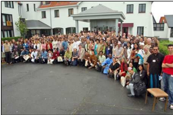
Los participantes en frente del centro de conferencias

Fue una oportunidad para hablar sobre numerosos asuntos de actualidad para el movimiento del comercio justo: normalización ISO, proyecto de un label "Organización de Comercio Justo" que se puede utilizar sobre los productos, acceso a los mercados para la artesanía justa, turismo y comercio justo, etc.