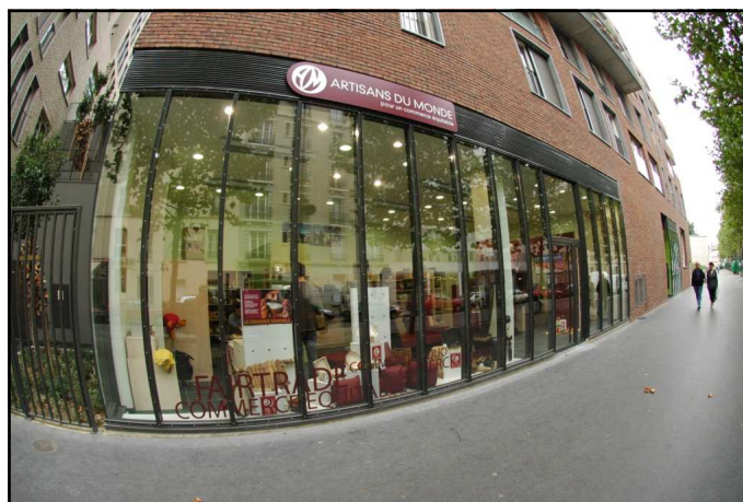
La primera tienda presentando la nueva cara de Artisans du Monde, en París.