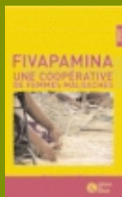
Fédération Artisans du Monde Vagalume Productions 21 minutes - 2002