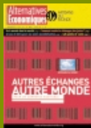
Fédération Artisans du Monde Hors série Alternatives économiques 2004