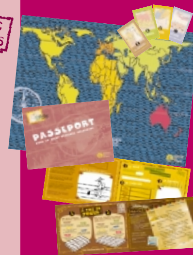
Fédération Artisans du Monde 2004

termine par un moment convivial de dégustation de produits du commerce équitable. Le kit contient un manuel pédagogique de 27 pages (composé de la trame d'animation d'environ 2h mais aussi de fiches de fond, de recettes, etc), 25 passeports 'jeux' pour les enfants, un planisphère, un jeu de 18 cartes et enfin des échantillons de produits bruts.