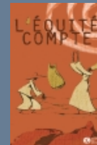
Fédération Artisans du Monde Pangea 5'30 minutes – 2003

Cet outil tout public constitue une première approche originale des enjeux du commerce équitable.