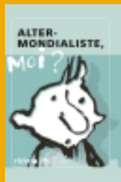
Fédération Artisans du Monde Ritimo 96 pages Format A5 - 2004